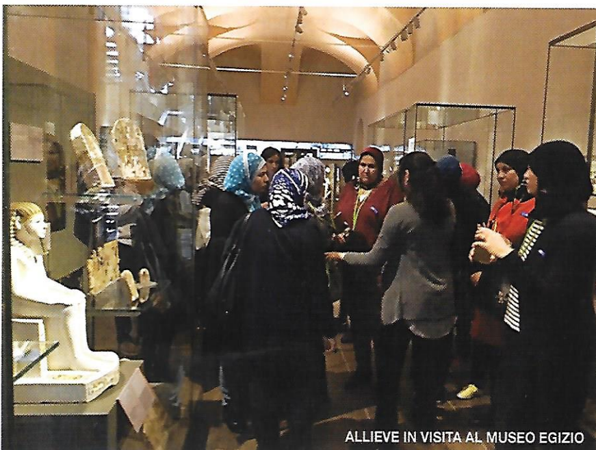
ALLIEVE IN VISITA AL MUSEO EGIZIO

Siamo felici di poter dare loro l'opportunità di raggiungere gli obiettivi che ciascuna si è data: c'è chi da poco tempo a Torino desidera apprendere la lingua per non sentirsi isolata; oppure chi conoscendo già qualche parola o semplice frase, vuole migliorarsi al fine di sostenere il test A2 di lingua italiana per ottenere il sospirato