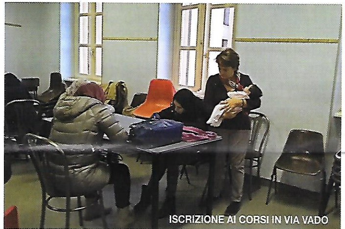
ISCRIZIONE AI CORSI IN VIA VADO

Come non commuoversi davanti alla loro situazione di donne fragili e anziane, talvolta vedove o abbandonate dal marito, costrette a lasciare il villaggio di campagna nel quale avevano sempre vissuto, con le sicurezze di un'intera esistenza, per vivere con la famiglia del figlio emigrato, in un paese totalmente estraneo alle loro tradizioni?